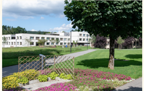
Aussenansicht Haus C