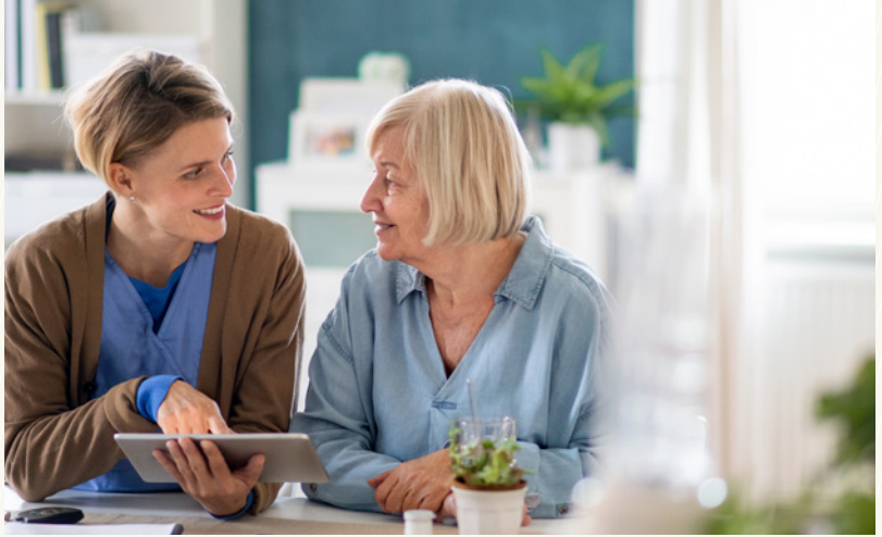
Die Aufsuchende Pflege unterstützt Betroffene zu Hause nach einem stationären Aufenthalt. (Symbolbild)