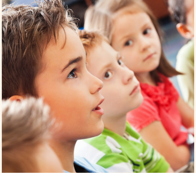
In der Gruppe werden die Aufnahme und Verarbeitung von Informationen trainiert. (Symbolbild)