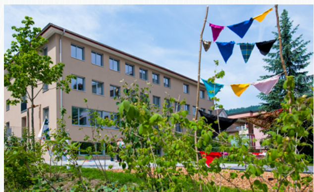
Kinderpsychiatrische Therapiestation, Kriens

Auch wenn die Psychopharmakotherapie bei den wenigsten kinder- und jugendpsychiatrischen Störungen die hauptsächliche Therapieoption darstellt, ist sie doch ein Baustein in der Behandlung. Solide Kenntnisse der psychopharmakologischen Möglichkeiten und Grenzen sind unabdingbar. Einzelne Störungsbilder können überhaupt erst sozialpsychiatrisch oder psychotherapeutisch angegangen werden, wenn eine pharmakologische Grundlage gelegt ist. Im Verlauf der Entwicklung kann die Psychopharmakotherapie beim Übergang in eine nächste Lebensphase (beispielsweise bei einem Schul- oder Schulstufenwechsel) helfen und in dritten Fällen, wie z. B. bei Psychosen oder bipolaren Erkrankungen, gilt es, eine Langzeitkooperation mit den Patienten für eine ebensolche Langzeitpharmakotherapie zu erarbeiten und zu definieren. Insgesamt ist diese ein hoch komplexer und anspruchsvoller Teilaspekt, der es unserem Fach ermöglicht, den Patientinnen und Patienten sowie anderen Disziplinen wichtige Unterstützung zu bieten.