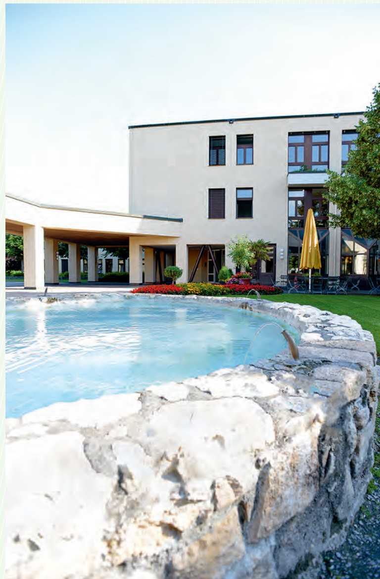
Eingangsbereich der Klinik St. Urban

Die Spezialisierung ist eine Gratwanderung. Zu viel Spezialisierung fördert eher längere Hospitalisationszeiten. Der Vorteil liegt aber ganz klar im fachlichen Know-how, das sich die Teams aneignen. Dadurch kann die Behandlung optimiert werden. —