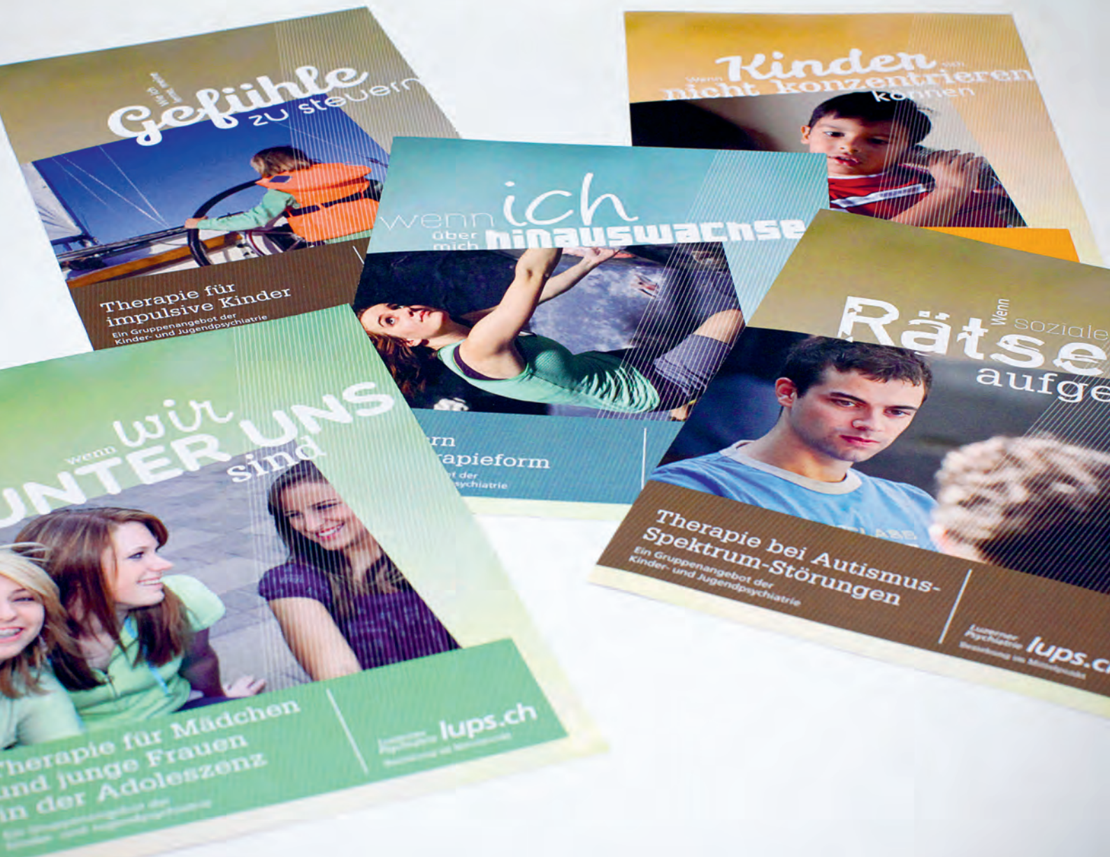
Gruppenangebote für Kinder- und Jugendliche