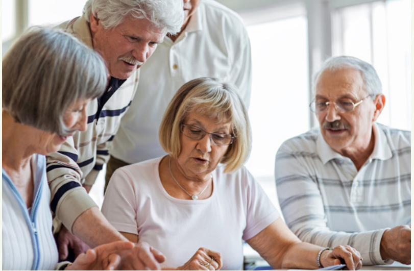
In der Gruppe werden Strategien zur Krankheitsbewältigung vermittelt und praktische Übungen trainiert. (Symbolbild)