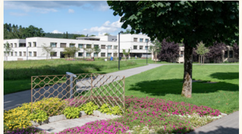
Aussenansicht Haus C