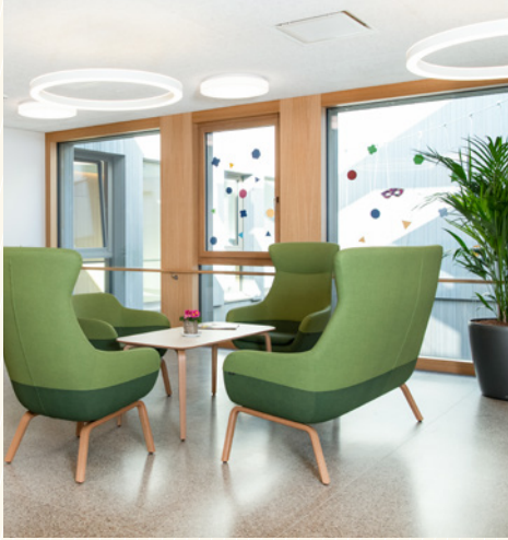
Die Station verfügt über verschiedene Aufenthaltsbereiche.