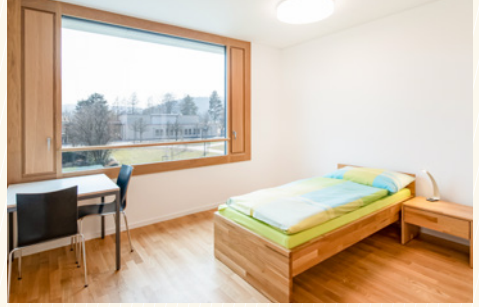
Die Station verfügt über Einzel- und Doppelzimmer.