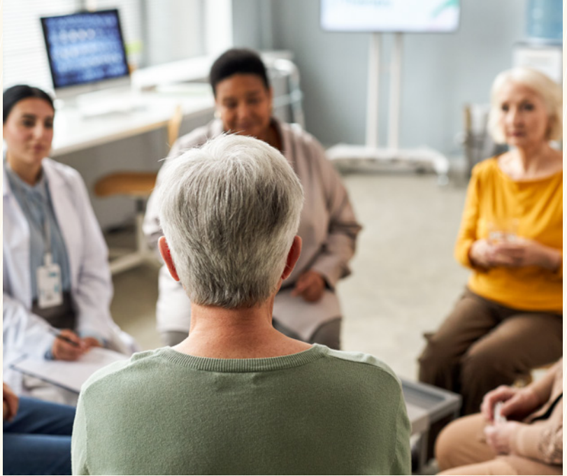
In der Gruppe werden verschiedene Themen behandelt. (Symbolbild)