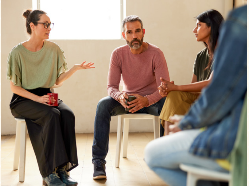
Die Gruppe soll einen offenen und wohlwollenden Austausch unter Eltern ermöglichen. (Symbolbild)