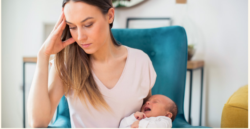
Eine Beratung kann helfen, schwierige Lebenssituationen zu bewältigen. (Symbolbild)