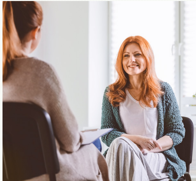
Regelmässige Einzel- und Gruppengespräche.

Sie können wöchentliche Gesprächstermine mit dem Chefarzt oder einem Leitenden Arzt wahrnehmen.