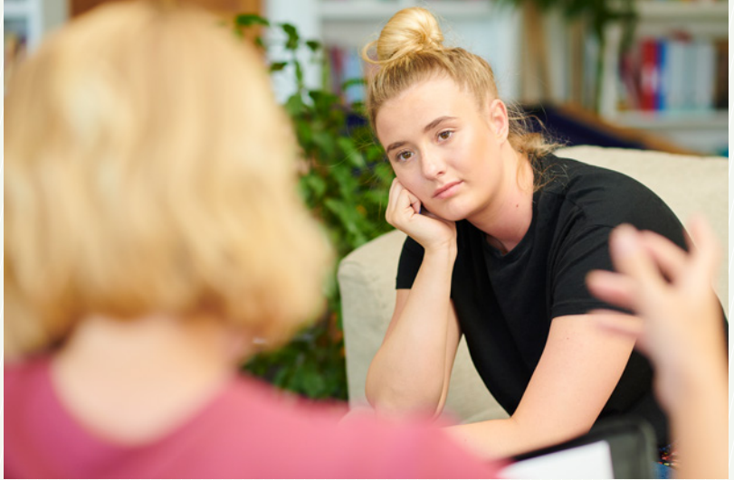
Gesprächssituation im vertrauten Umfeld (Symbolbild)