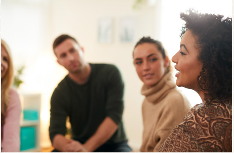
Das Gruppentraining soll die Fähigkeiten im Umgang mit schwierigen Situationen unterstützen und verbessern. (Symbolbild)