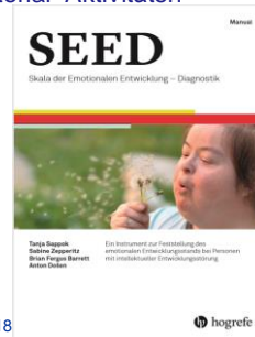
Sappok, Zeperitz, Barret, Dosen, Manual zur Skala der emotionalen Entwicklung – Diagnostik: SEED® Hogrefe 2018