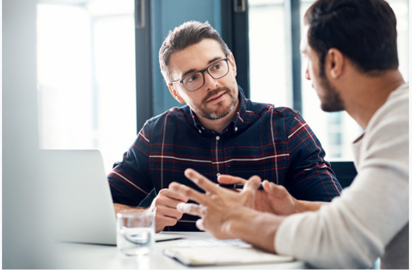
Das Team des Forensischen Dienstes steht in engem Kontakt mit den verantwortlichen Dienststellen. (Symbolbild)