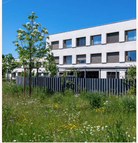
Aussenansicht Haus C mit Demenzgarten