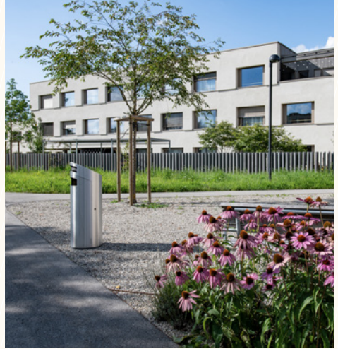
Aussenansicht Haus C