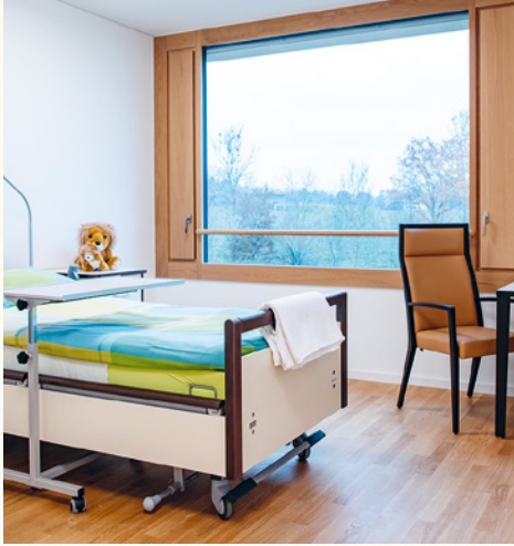
Die Station verfügt mehrheitlich über Einzelzimmer