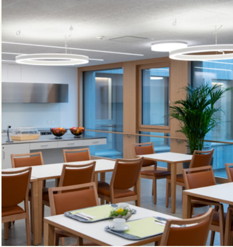
Aufenthalts- und Essbereich