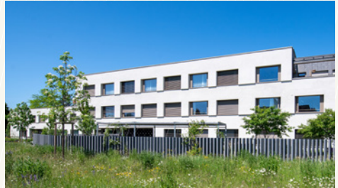
Aussenansicht Haus C