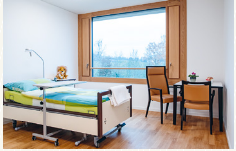
Die Station verfügt ausschliesslich über Einzelzimmer