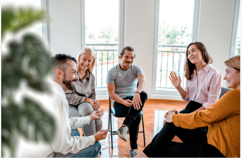
Alltagsnahe Beispiele werden in der Gruppe geübt. (Symbolbild)