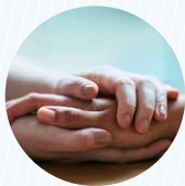
In Beziehung sein