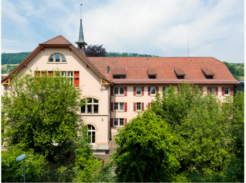
Aussenansicht Therapiestation JPS